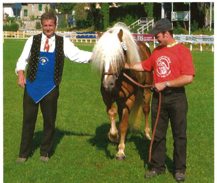
Foto: Norbert Rier (Kastelruther Spatzen) und Andreas Siegenthaler avec Etalon Azoro v. Allogéne