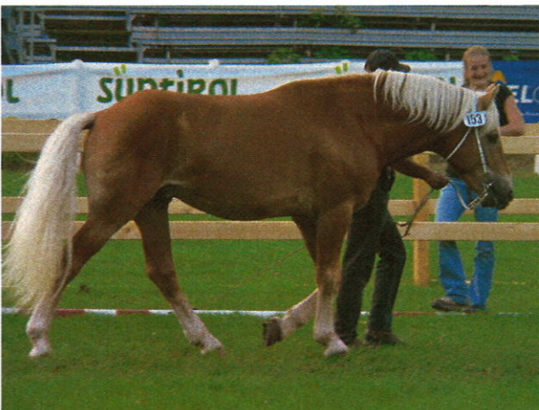
Foto: Zuchthengst Sarol-G

Es lebe der Europäische Verband der Haflingerpferdezüchter.